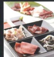
おすすめ刺し4点セット(事前) 馬刺し盛合せ5種(奥)

住所 / 八王子市寺町51-2 志賀屋ビル2F 交通 / JR中央線ほか八王子駅北口より徒歩約6分 営業時間 / 火～土曜 17:00～翌5:00 (L.O.翌4:30) 日曜 17:00～24:00 (L.O.23:30) 定休日 / 月曜