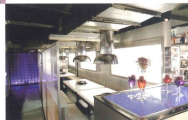
間接照明でムード満点

J R八王子駅から徒歩6分。白を基調としたスタイリッシュな店内で、九州産を中心としたA5ランクの黒毛和牛の焼肉がいただける。そのほか豚や鶏、馬刺しなど多彩なメニューや、ワインやカクテルなどのアルコール類の飲み物も充実している。特に店名の由来になっているジンギスカンもおすすめ。店内の雰囲気も抜群で、カップルや友人、ファミリーなどの大切な人と、時間を忘れて楽しいひとときを過ごしたい。