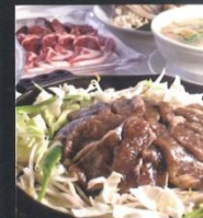
北海道直送のマトンを使用したジンギスカン